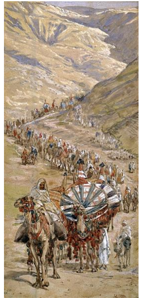
La caravane d'Abraham James Tissot

nous invite à être adultes dans la foi : arrivés dans la terre promise, nous avons à faire fructifier les dons que nous avons reçus.