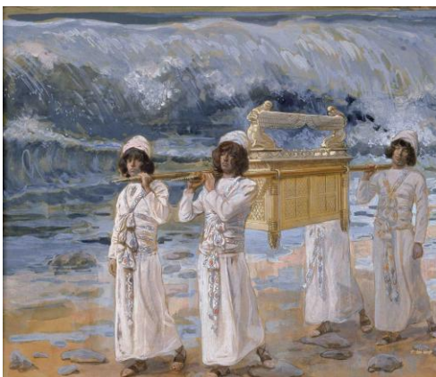
L'arche d'alliance traverse le Jourdain James Tissot

Le 5 ème dimanche ( Livre du prophète Isaïe 43, 16-21 )